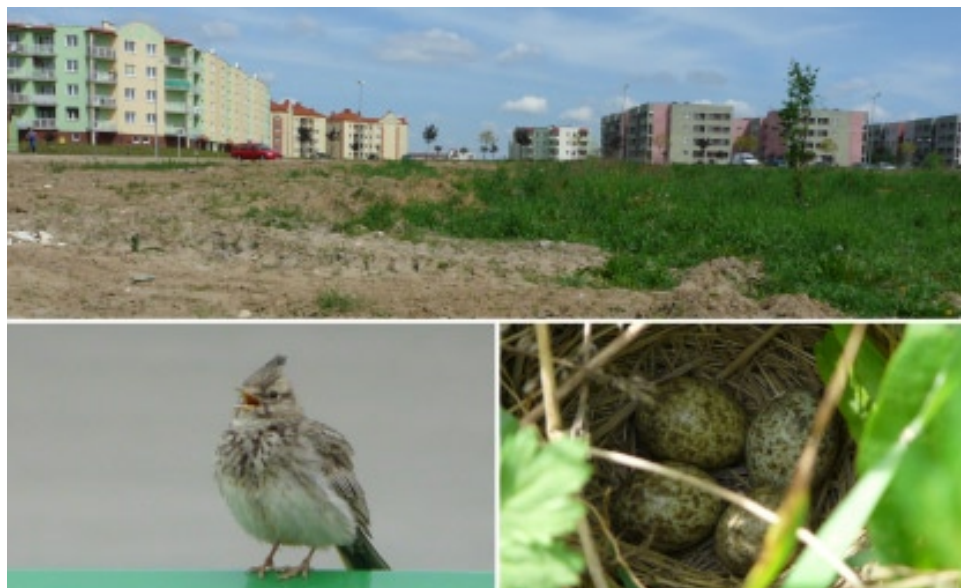
Fot. 1. Siedlisko dzierlatki Galerida cristata, śpiewający samiec i zawartość gniazda znalezionego 20.05.2008 na osiedlu Dobrzec w Kaliszu - Habitat of Crested Lark Galerida cristata, singing male and nest found on 20th May 2008 in the Dobrzec housing estate in Kalisz