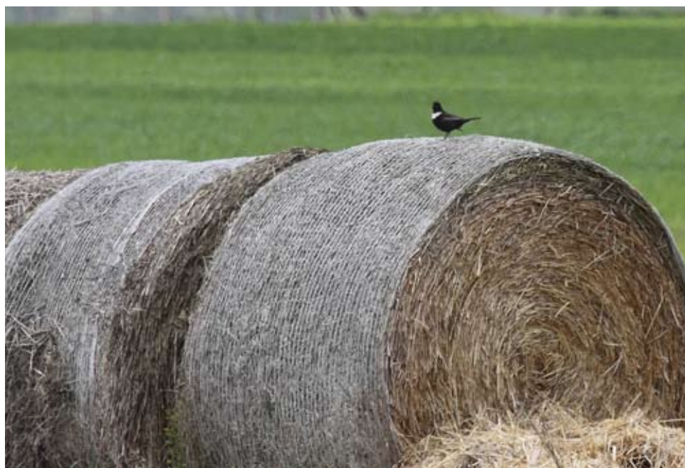
Fot. 6. Drozd obroźny Turdus torquatus , kwiecień 2016, Wielichowo, pow. wolsztyński – The ring ouzel Turdus torquatus , April 2016, Wielichowo, Wolsztyn County