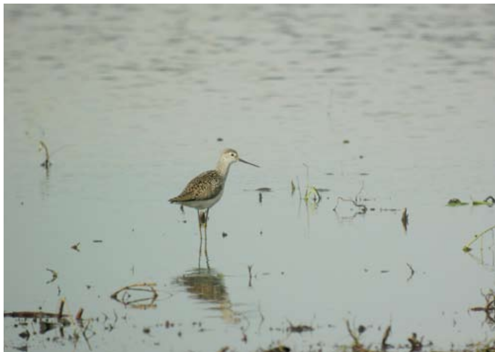
Fot. 3. Brodziec pławny Tringa stagnatilis , maj 2016, stawy Smogulec, pow. wągrowiecki – The marsh sandpiper Tringa stagnatilis , May 2016, Smogulec ponds, Wągrowiec County