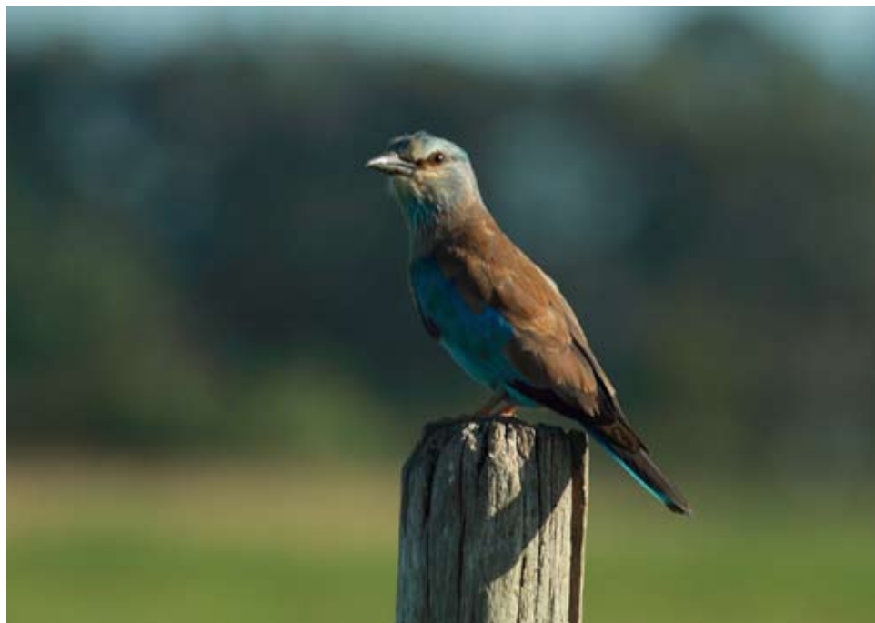
Fot. 5. Kraska Coracias garrulus , wrzesień 2016, Przemęt, pow. wolsztyński – The European roller Coracias garrulus , September 2016, Przemęt, Wolsztyn County