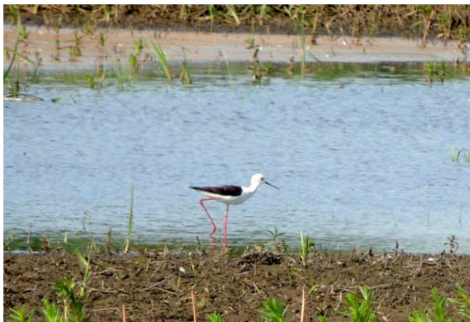
Fot. 2. Szczudłak Himantopus himantopus , maj–lipiec 2016, Gąsiorów, pow. kolski – The black-winged stilt Himantopus himantopus , May–July 2016, Gąsiorów, Koło County