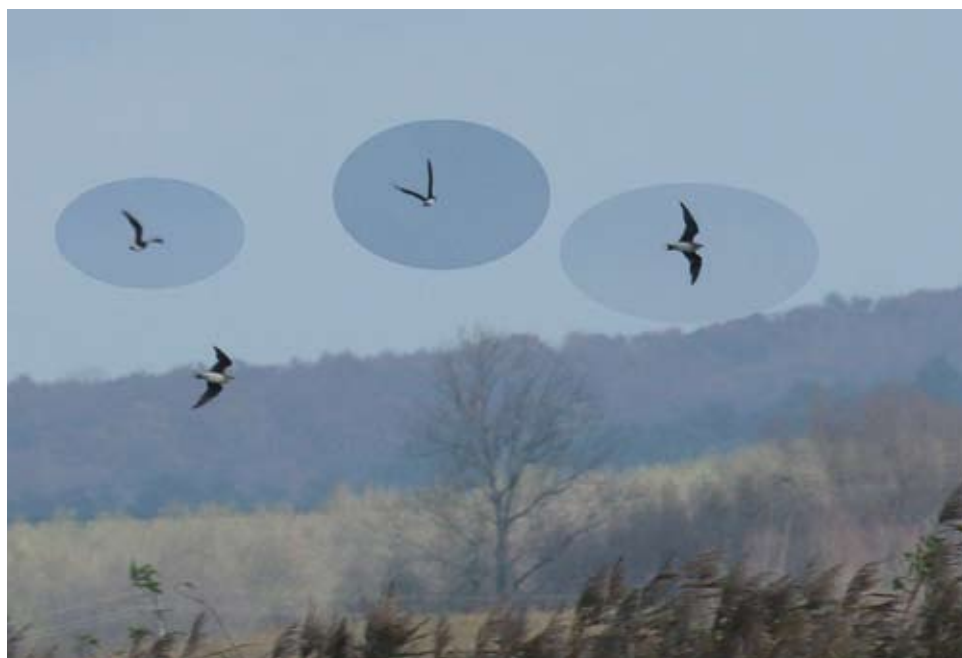
Fot. 4. Żwirowiec stepowy Glareola nordmanni , październik 2016, Smogulec, pow. wągrowiecki – The black-winged pratincole Glareola nordmanni , October 2016, Smogulec, Wągrowiec County